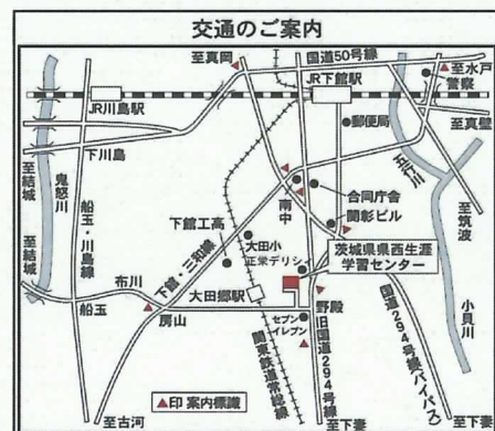
関東鉄道常総線大田郷駅徒歩8分 (案内板あり)

個人情報、当講座に関するもののほかには使用いたしません。なお、受講中撮影した写真をホームページ等に掲載することがありますので、予めご了承ください。