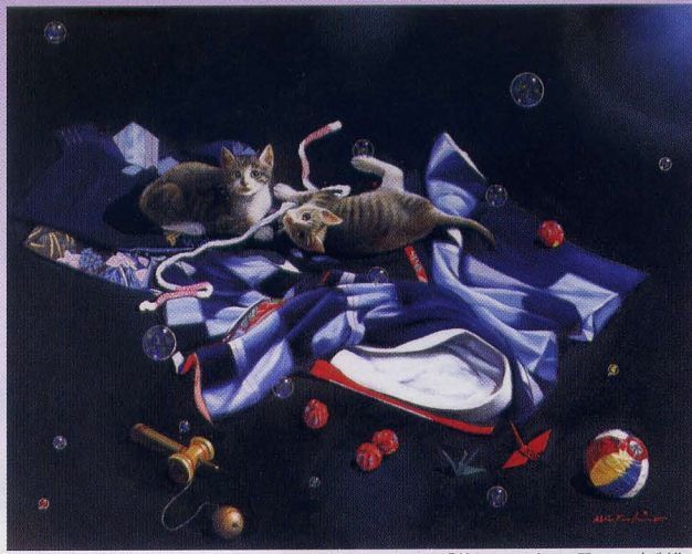
「戯れ」ル・サロン展 2003年制作