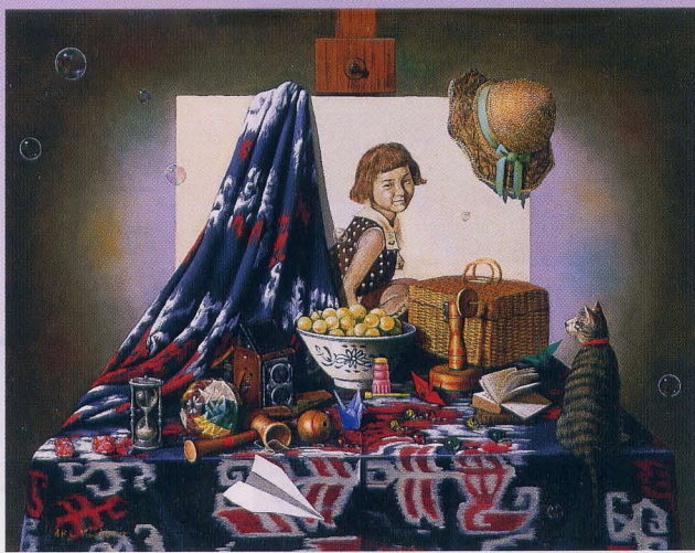
「想い出」ル・サロン展 1998年制作