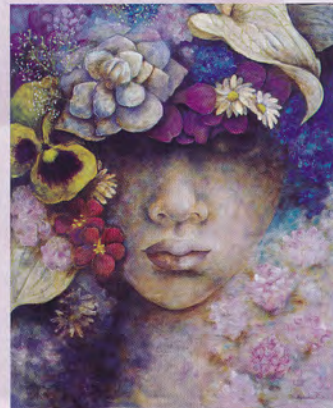
「True colours (心の色) B」 2009年 第94回二科展