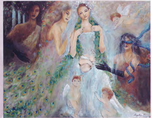
「誕生」1999年・第84回二科展