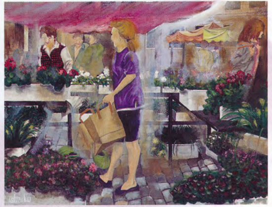
「朝の香り」1990年作・第75回二科展

1990年20歳の時に第75回二科展にて初入選を果たし、油彩画家としての一歩を踏み出した。以後、二科展では16回入選、うち2010年の第95回展では特選を受賞するなど、その才能を大きく開花させた。国内各地でも個展を開催している。