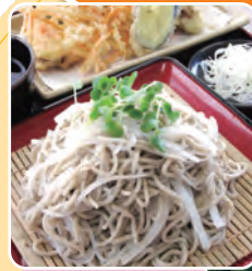
あけの アグリショップ すずしろそば

ひまわりフェスティバル 会場の近隣には 宮山ふるさとふれあい公園や あけのアグリショップなど 楽しいこと・おいしいこと がいっぱい! みなさんのご来場を お待ちしております。