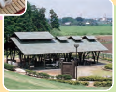
水あそび場 バーベキュー場 宮山ふるさと ふれあい公園