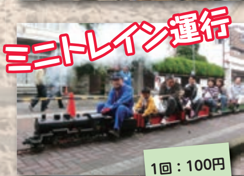
ミニトレイン運行