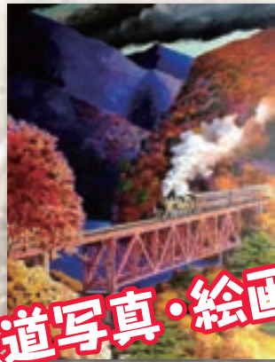
鉄道写真・絵画展