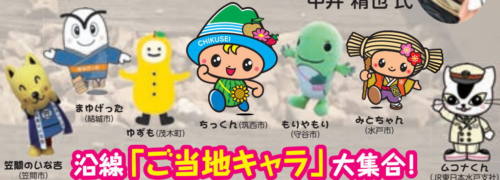
沿線「ご当地キャラ」大集合!